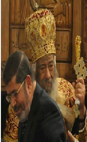
الرئيس المصري محمد مرسي يهنئ قداسة البابا ليلة عيد الميلاد